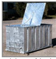
3501 – pozinkovaná bedna na ryby