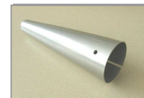
3000 - tulej nerez 3001 – tulej