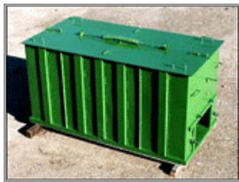
2048 – přepravní bedna na ryby

Skládá se z nosné kostry, 4 ks plováků, vodní a větrné vrtule a převodovky. Zajišťuje pohyb teplejší spodní vody ke hladině. Jeho umístění je třeba volit mimo závětrí, kde je dostatečně proudící vzduch.