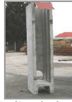
3072 – požeráková výpust 500/3500