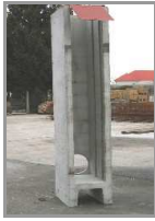
3071 – požeráková výpust 300/2500