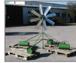
2036 – větrný rozmrazovač Paulát