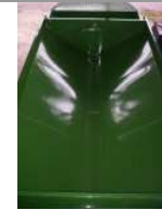
2045 - dvoušpicá vyplavovací loď 6m