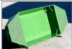
2030 – dvoušpicá loď 4m

Zesílení plechu dna na 2,5 mm – možno i více, zesíleny výtzuhy na dně, zaobleny hrany na vypouštěcím otvoru, změněno původní zajištění adaptéru na zajištění řetízkem. Pevné víko nebo adapter se objednává samostatně